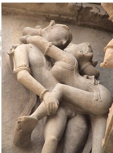
Maithuna – Matrimonio sacro , Tempio Kandariya Mahadeva, Khajuraho, Madhya Pradesh – India, XI sec.

Questo è l'amore ideale esaltato da Dante e analogamente da Papa Francesco nella sua Amoris laetitia : amore fra le persone che unendosi si danno gioia, dimenticandosi del proprio bene e di sé, per dedicarsi completamente al bene dell'altro e amplificare la percezione dell'essere in un senso tantrico 29 , per così dire, orientale.