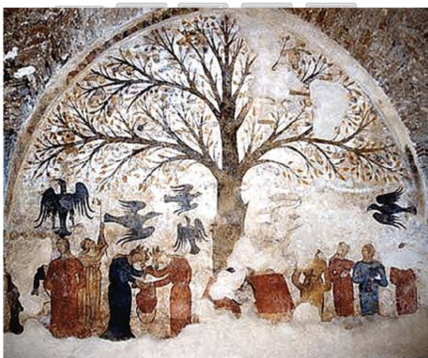
Anonimo, Pianta dai frutti itifallici , Massa Marittima – Grosseto, seconda metà del XIII sec.